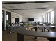
Freistellungen vom Unterricht